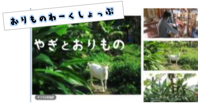
おりものわーくしょっぷ