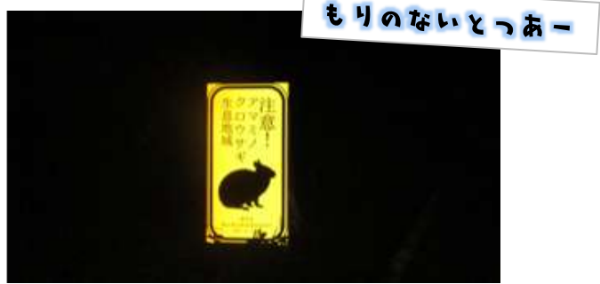
もりのないつあー