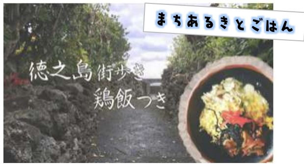
まちあるきとごはん