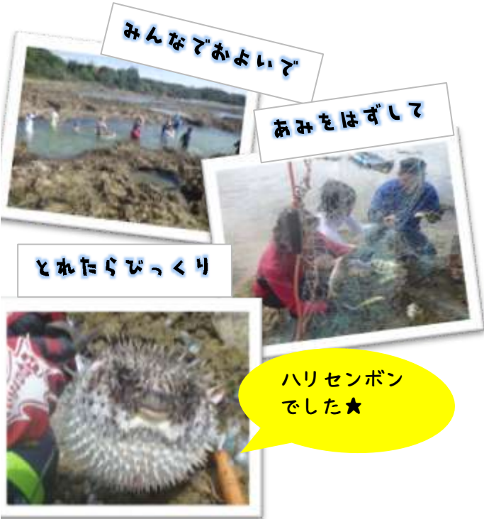
みんなでおよいご

サンゴ礁の磯から海に向かって歩いて泳いで魚を追い詰める「追込み漁」を体験できます