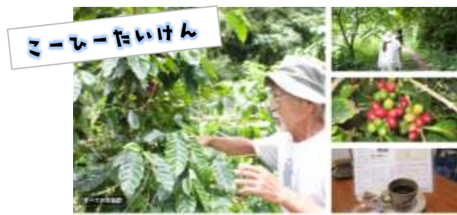
ミーミーたいけん